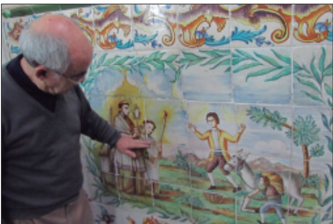
El rector mostra els taulells de la capella de Sant Antoni.

Corpus Christi de València i basats en episodis de la vida del Patriarca, concretament en una missa oficiada per Joan de Ribera i en l'última comunió.