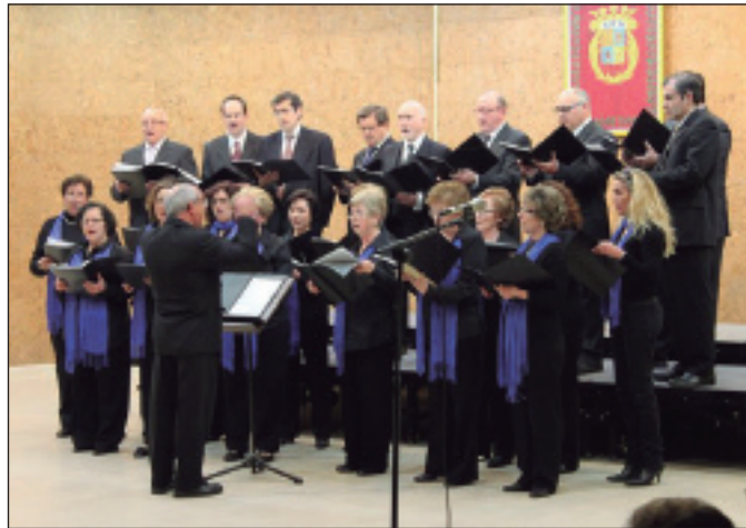
Coral Joan de Ribera d'Alfara del Patriarca.