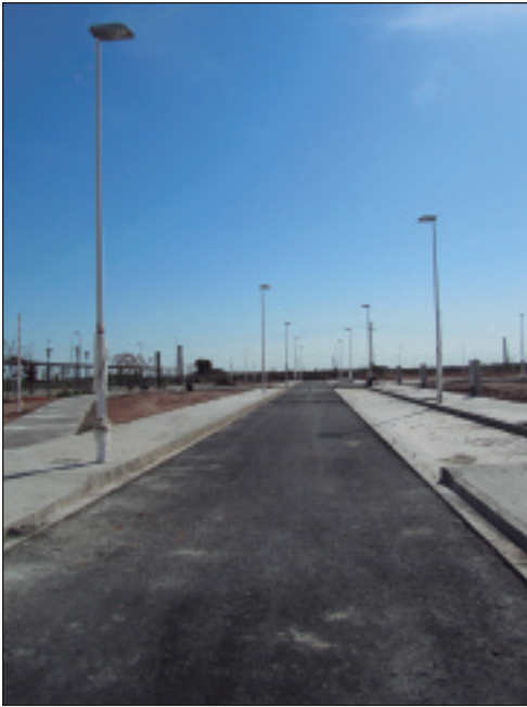
Zona urbanitzada dels Rajolars.