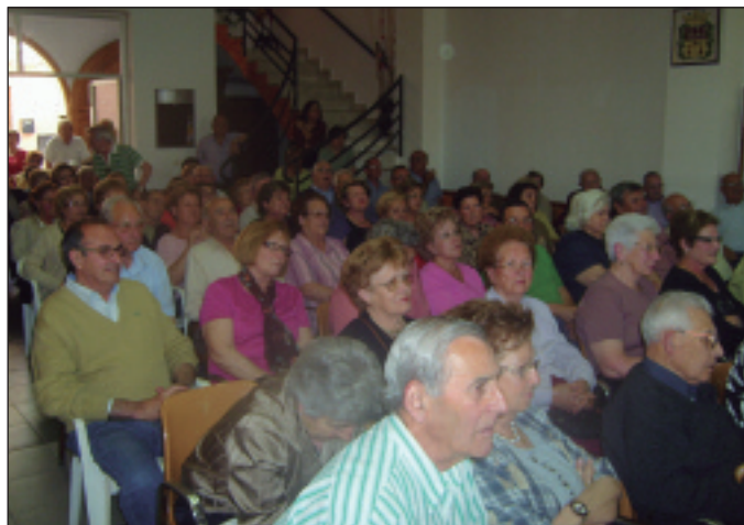
Xerrada durant la Setmana Cultural dels Jubilats de l'any passat.

La junta es troba preparant les activitats per a la Setmana Cultural, que tindrà lloc entre el 9 i el 13 de maig, amb activitats, xerrades, un viatge