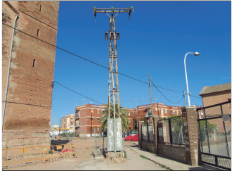
Tram d'accés al Puntarró des de l'antiga Conservera que serà ampliat amb una modificació del PGOU.