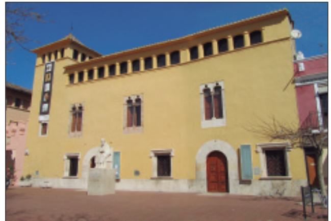
Palau de la Senyoria d'Alfara del Patriarca.

Eixes són les principals patologies de l'immoble, segons s'extrau d'un estudi exhaustiu realitzat per part d'un despatx d'arquitectura a instàncies de la Conselleria de Cultura. No obstant, el Castell, com es coneix col·loquialment l'edifici, declarat Bé d'Interés Cultural en la categoria de monument i inclòs en l'inventari del Ministeri de Cultura, contempla moltes altres deficiències, sobre les què s'haurà d'anar