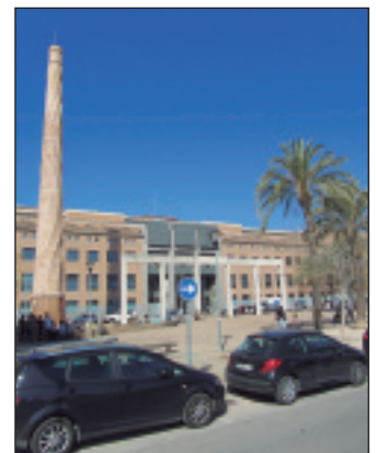
Universitat Cardenal Herrera Ceu.

Això comportarà la peatonalització d'alguns carrers i l'ampliació de la plaça del fumeral, la construcció de dotacions esportives compartides i la promoció econòmica i social del municipi.