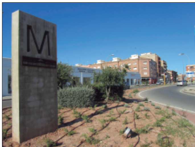
Molló ubicat a la rotonda d'entrada al poble.

A més, al sostre d'altres edificis municipals, com ara la biblioteca, el col·legi públic o l'escoleta, també s'ubicaran plaques fotovoltaïques en el futur.