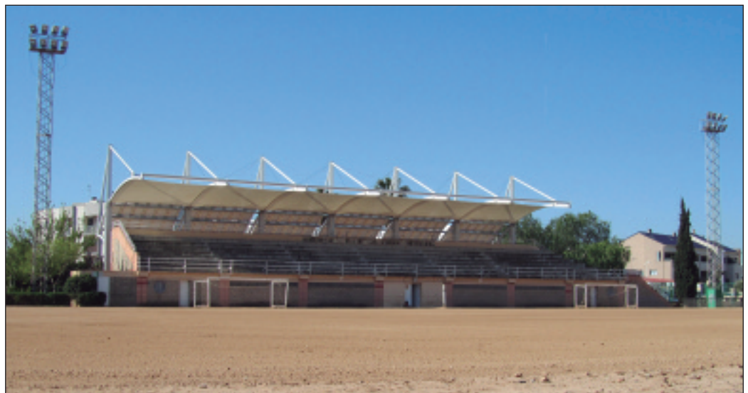
Camp de futbol del poliesportiu municipal d'Alfara del Patriarca.

El conveni signat és fruit de la insistència de l'equip de govern, que havia vist com l'anterior projecte relatiu a esta mateixa qüestió, emmarcat dins de la subvenció del programa Sona la Dipu, quedava endarrerit i no es concretava la seua realització.