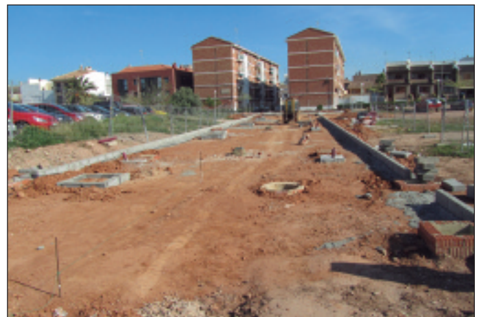
Nou carrer a la zona del Puntarró.