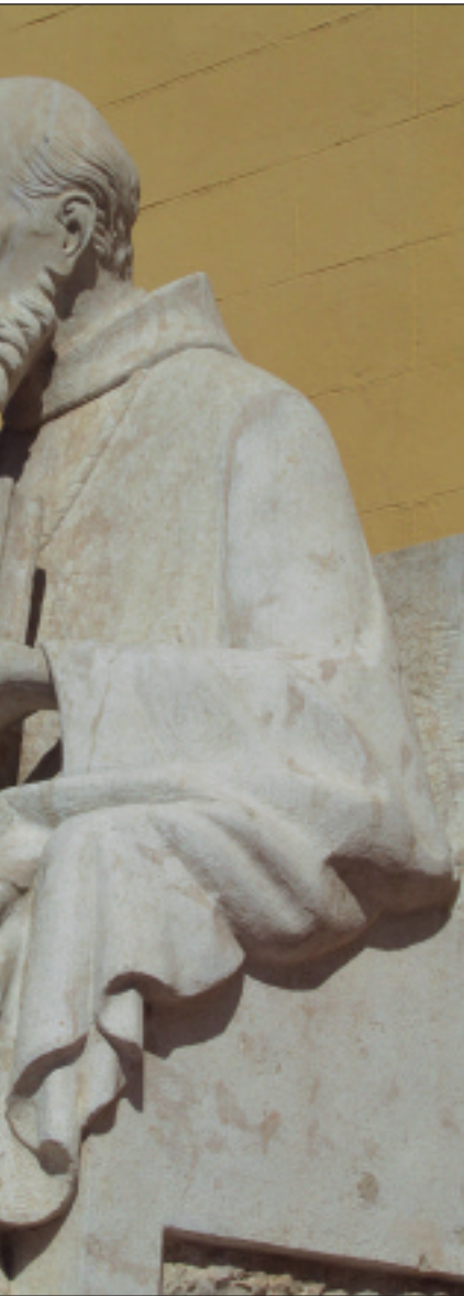
Statua d'Alfara del patriarca.