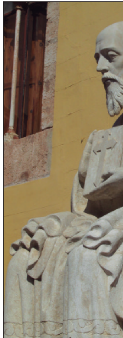
Escultura de Sant Joan de Ribera a la plaça de l'església