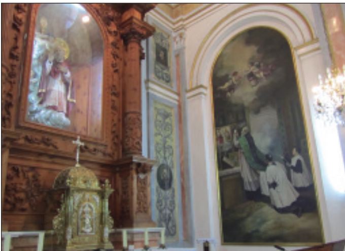
Capella de la Comunió de l'església d'Alfara amb un dels quadres de Manuel Diago.