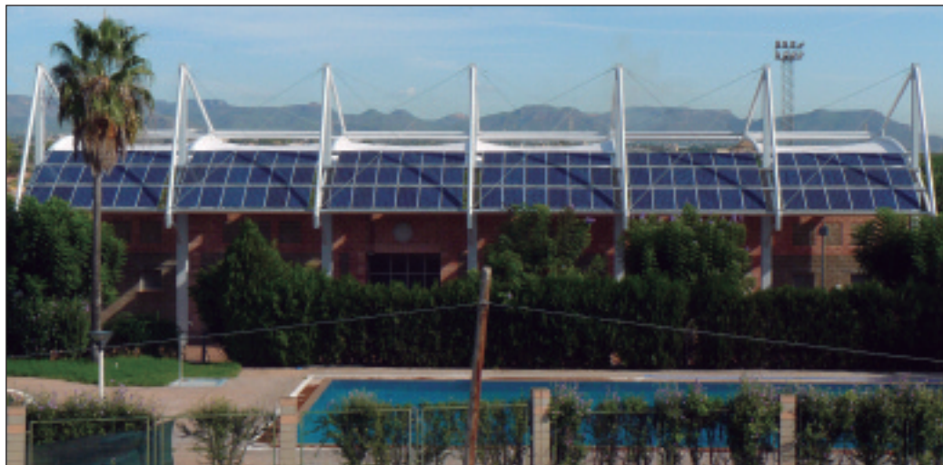
Plaques fotovoltaïques al sostre de la coberta de la graderia del camp de futbol.

L'Ajuntament està promouent altres mesures per a fomentar el desenvolupament