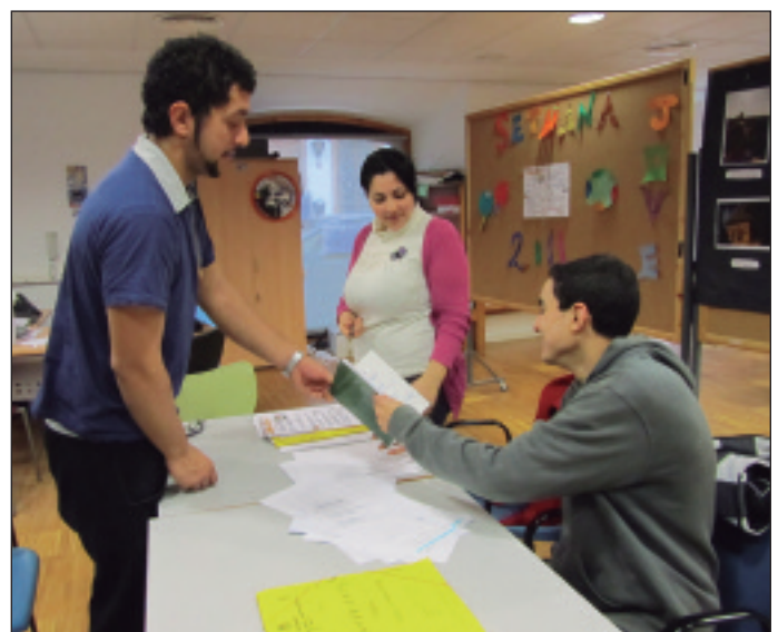
Alumnes del TFC realitzen el període de pràctiques a l'Espai Jove.

Quan finalitze el curs, estos joves tindran l'oportunitat d'inserir-se laboralment als municipis que conformen la Mancomunitat del Carraixet.