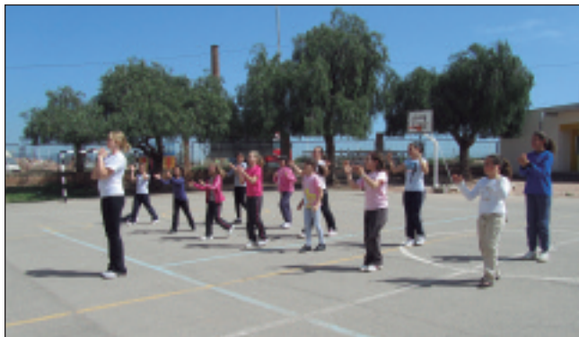
La lectora d'anglés en una classe d'educació física.

I és que el centre educatiu d'Alfara està més participatiu que mai, ja que el passat diumenge 10 d'abril va estar present a la Trobada d'Escoles en Valencià, una jornada festiva que es va desenvolupar a Burjassot on es va reclamar als responsables institucionals que facen del valencià la llengua pròpia