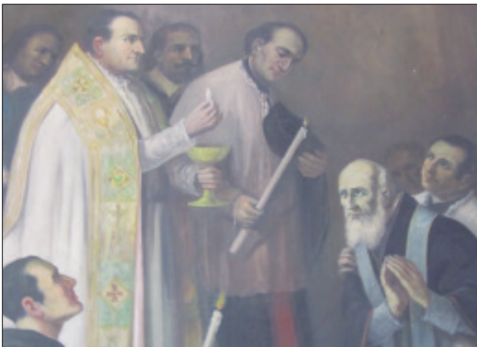
Detall d'un dels llenços de la capella de la Comunió.