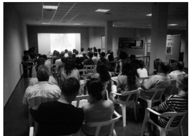
Estudiants i veïns, a la presentació dels resultats del taller de mobilitat.

La jornada, celebrada el passat 14 juny, es va inscriure en els debats del Fòrum de l'Agenda 21 Local del nostre poble.