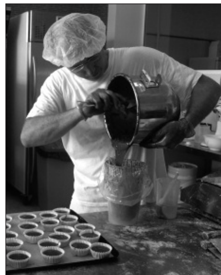
Un forner prepara pastissos sense gluten.