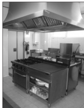
Cuina de l'Escoleta.

Així, l'augment del nombre de comensals possibilitarà que comence a funcionar la cuina moderna de l'Escoleta, després que la seua explota-