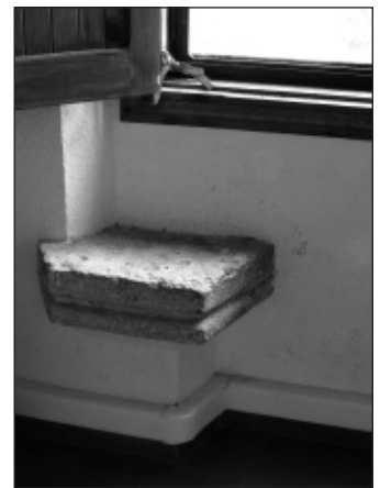
Festejador d'una finestra del Castell.

Per eixe motiu, la Conselleria de Cultura, a instàncies de l'Ajuntament, ha encarregat al despatx d'arquitectura de Francisco Cervera Arias la realització de l'estudi previ de l'edifici, amb l'elaboració d'una diagnosi de caràcter històric, geomètric i constructiu i un apartat conclusiu amb l'aportació de propostes d'intervenció segons la gravetat dels problemes detectats.