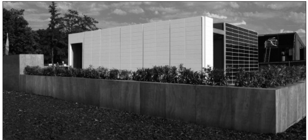
Casa sostenible SML House.

Per altra banda, per al proper curs, també pretenen realitzar campanyes de sensibilització als centres escolars d'Alfara del Patriarca, per a que els xiquets de 3 a 12 anys entenguen la necessitat de cuidar les dents des de ben menuts.