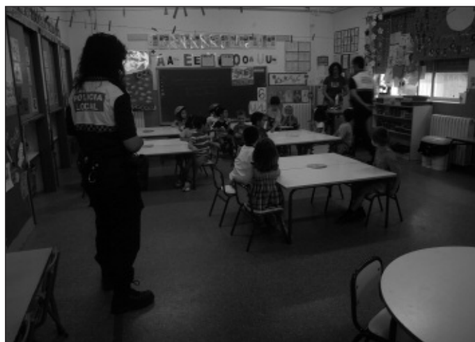
Els agents ensenyen als xiquets les senyals bàsiques de circulació.

Per tal de fomentar una bona convivència ciutadana, la Policia Local prega als veïns d'Alfara que estacionen els vehicles correctament, i que eviten envair les voreres i els passos de vianants.