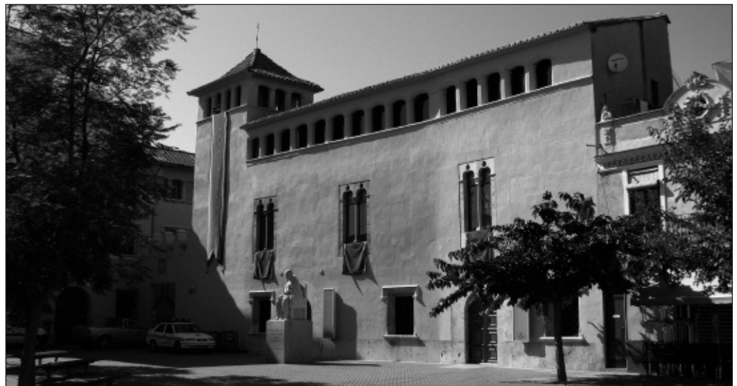
Palau de la Senyoria d'Alfara del Patriarca.