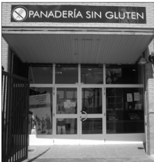
Forn especialitzat en productes sense gluten.

I perquè no passar les vacances al poble? Disfrutem de la piscina que ara sí tenim, sortim al carrer a prendre la fresca i gaudim de les festes.