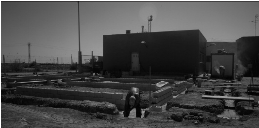
Els operaris treballen en la construcció d'un menjador a l'escola infantil municipal d'Alfara.