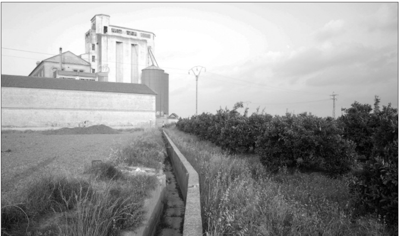
Horta d'Alfara del Patriarca, en un dels ramals de la Sèquia de Montcada junt el Molí.

El document es troba ara dins els terminis d'exposició pública, i pot ser consultat mitjançant la web de la Generalitat, www.cma.gva.es .