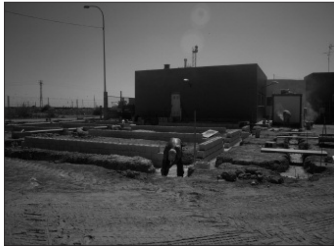
Els operaris treballen en els fonaments del nou menjador.

Ja han començat les obres per a construir un menjador a l'escola infantil municipal d'Alfara, que també acollirà els alumnes del col·legi públic. L'augment del nombre de comensals possibilitarà que comence a funcionar la cuina de l'Escoleta, després que la seua explotació ixca a subhasta pública, amb la creació de llocs de treball que això comporta. El Sant Joan de Ribera alliberarà així l'espai que ara utilitzen els alumnes per dinar i l'habilitaran com a biblioteca.