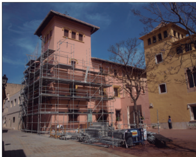
Bastida a la façana de l'Ajuntament que va permetre l'accés a la teulada de la torre.

El Doctor Navarro va encomanar la construcció de l'edi-