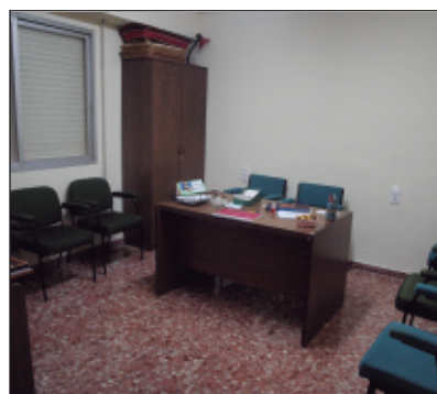
Despatx a les instal·lacions de les ames de casa.

L'Ajuntament ha remodelat el local municipal del carrer la Nòria, antigament seu de la Cambra Agrària, i l'ha cedit a l'Associació d'ames de casa Tyrius. La planta baixa que ocupaven vora el Castell s'adequarà per a la Policia Local.