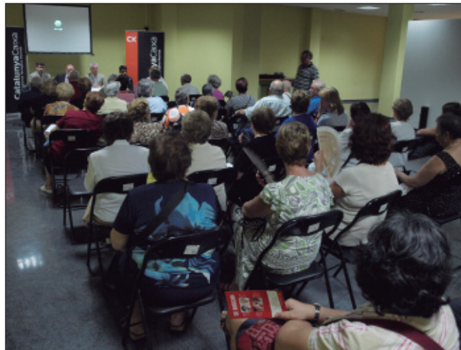
Presentació del programa “Viure i Conviure” al Centre Cívic d'Alfara.

La iniciativa, que va ser presentada el passat divendres 17 de setembre a les ins-