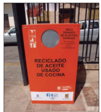
Contenidor d'oli als Jardins municipals.

Al contenidor ubicat als Jardins municipals, durant els 6 primers mesos, es varen recaptar un total de 538 litres d'oli de cuina gastat.