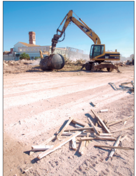
Urbanització dels terrenys de l'antiga fàbrica de mistos.