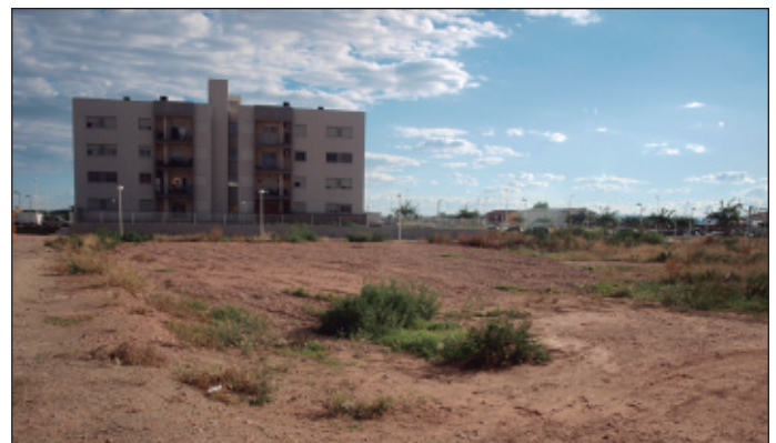
Terrenys municipals a la partida del Puntarró.

Una d'elles es destinarà a edificar un centre de dia per a persones majors, mentre que en l'altra, de major superfície, es construiran pisos de lloguer mitjançant un conveni amb l'Institut Valencià de la Venda (IVVSA).