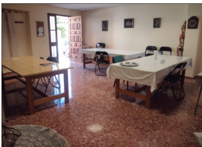
Saló principal del local de les ames de casa.

Serà ocupada pels agents de la Policia Local d'Alfara del Patriarca, que per fi comptaran amb un espai propi, adaptat i definitiu per desenvolupar les seues tasques.