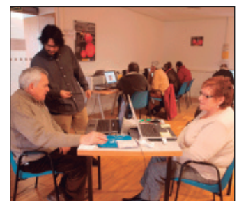
Edicions anteriors del curs.