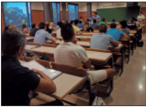
Opositors per a la Policia Local.