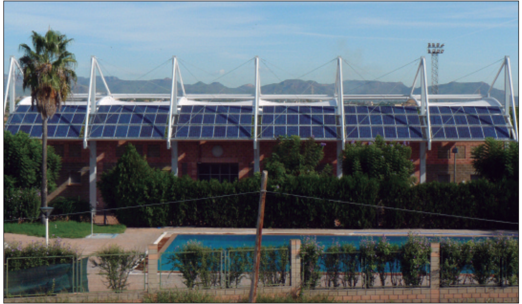
Plaques fotovoltaiques al sostre de la coberta de la graderia del camp de futbol.

D'una banda, s'ha vist millorada l'estada dels espectadors dels partits amb la construcció d'una coberta que els protegeix de les inclemències meteorològiques. D'altra part, ha quedat demostrada la clara aposta de l'equip de govern de la població per les energies renovables, amb la col·locació de plaques fotovoltaiques al sostre de la coberta per recaptar l'energia del sol i injectar-la a la xarxa elèctrica.