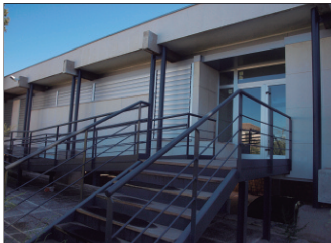
Antigues oficines de la Fosforera, rehabilitades amb el Pla E-2009.

L'empresa propietària dels terrenys va sol·licitar el canvi de la tipologia del sòl estipulada al Pla general d'ordenació urbana del municipi, d'industrial a residencial, que va ser tramitat per l'Ajuntament d'Alfara del Patriarca i acceptat per la Conselleria de Territori de la Generalitat Valenciana.