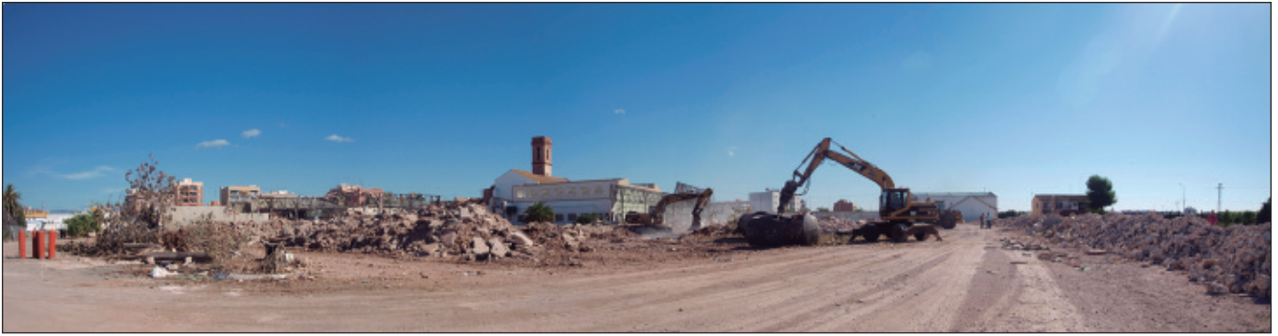
L'empresa Montelimar treballa en la urbanització dels terrenys de l'antiga Fosforera d'Alfara del Patriarca.