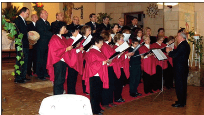
Coral Sant Joan de Ribera d'Alfara del Patriarca.

S'iniciarà a les 20.15 hores, en un espectacle del que tots podem gaudir i que comptarà amb la participació de la Coral Sant Joan de Ribera d'Alfara del Patriarca, el Cor de Bonre-