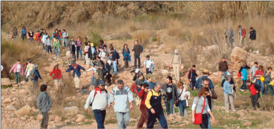
Baixada a peu pel Carraixet, en l'edició del 2009.