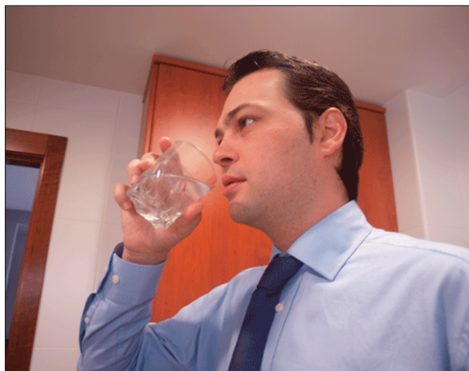
Un veí beu un got d'aigua emplenat directament des de l'aixeta.

Tan important és assabentar-se que la qualitat de l'aigua subministrada complix amb la legalitat vigent, com assegurar-se que no es produeix contaminació del subsòl o dels ca-