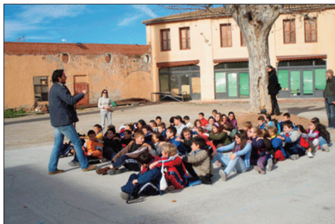
Els xiquets atenen les explicacions dels tècnics de la Fàbrica de la Seda de Vinalesa.

Els tècnics de la Mancomunitat varen adaptar la ruta a les exigències dels menuts, fent en primer lloc una sessió preparatòria al col·legi on es va explicar el contingut de la visita.