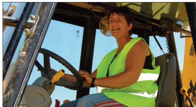
Una dona treballa amb el seu tractor.

Pot contactar amb el Pactem Nord a través del Centre Comarcal d'Igualtat d'Oportunitats d'Alfara del Patriara, ubicat al segon pis del Palau de la Senyoria.