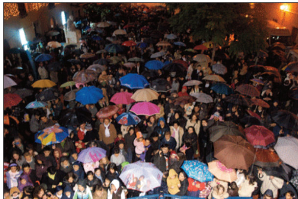
Malgrat la pluja, la gent va donar la benvinguda als Reis.

Passaven uns minuts de les 18.30 h. quan Melchior, Gaspar i Baltasar arribaven al poble pel Calvari, acompanyats per tot el seu seguici.