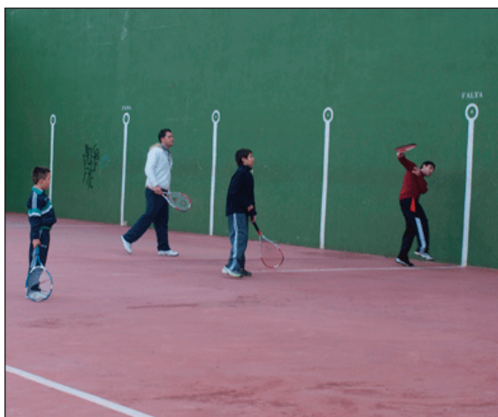
Escola de frontenis.

Ès voluntat de la regidoria d'esports de l'Ajuntament d'Alfara promoure i mantindre les activitats esportives que es desenvolupen al municipi. Hi ha moltes que funcionen realment be, com ara les classes de gimnàstica que manteniment, pilates o aeròbic, totes elles desenvolupades al gimnàs municipal.