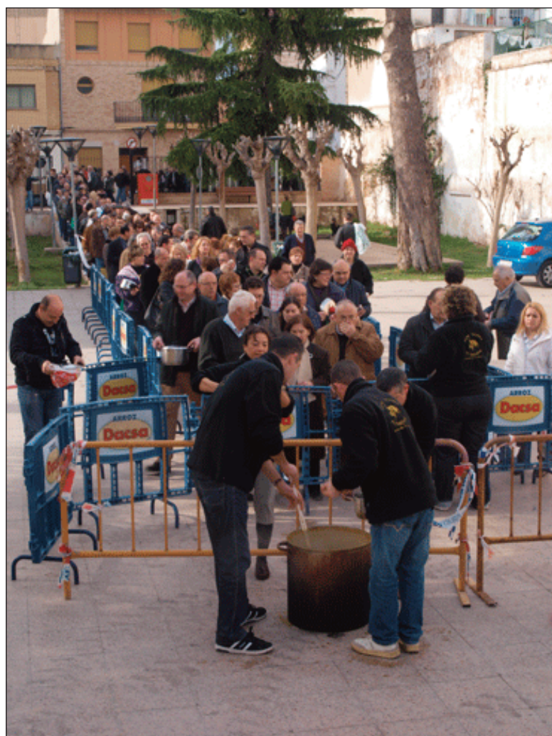
La gent espera el seu torn per rebre un plat de caldera als Jardins Municipals.

Els membres de la Peña Taurina Alfarense cuinaren 7 calderes que van repartir en prop de 800 racions.