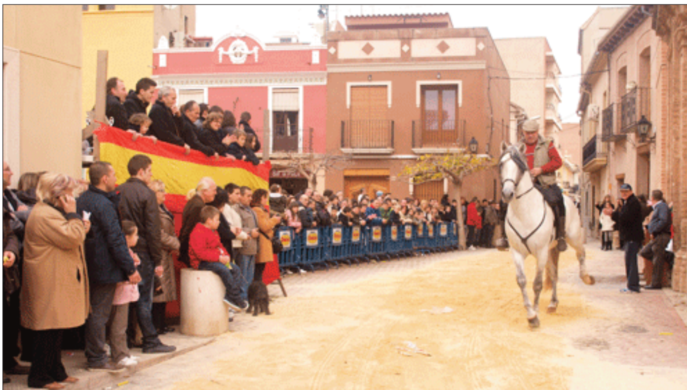
Un genet passa amb el seu cavall per l'estrada de la Peña Taurina Alfarense.