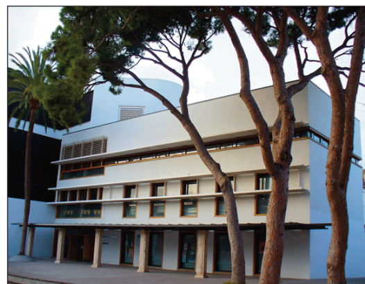
Edifici de Don Emilio, on s'ubica l'Espai Jove.

Amb aquest, ja són 4 els anys que l'Espai Jove està en funcionament. Una de les principals mancances detectades pel tèc-