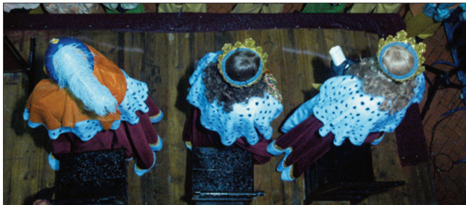
Els Reis Mags d'Orient saluden al poble d'Alfara a la plaça de l'Ajuntament.

Tot seguit, Reis i patges repartiren els regals dels xiquets casa per casa, portant felicitat en la nit més màgica de l'any.