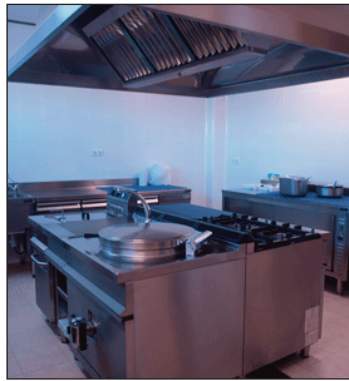
Cuina, encara per estrenar.