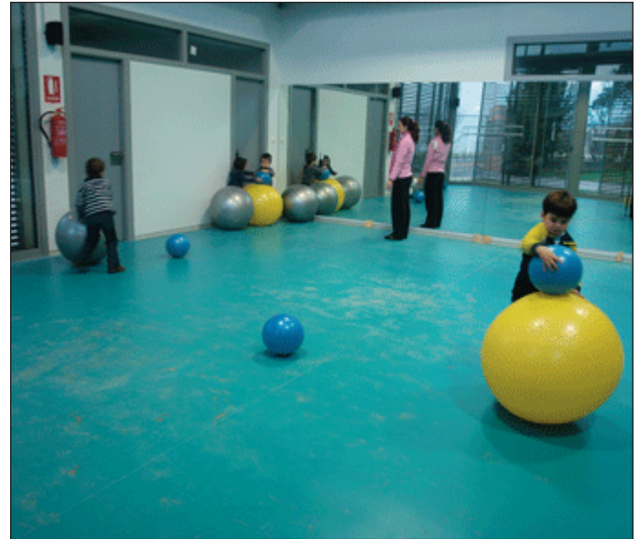
Els alumnes de psicomotricitat, a la zona ampliada del gimnàs municipal.

Vestidors, magatzems per amagar el material emprat als cursos i un bany per a discapacitats completen l'obra, que a més s'ha fet pensant en l'estalvi energètic. D'aquesta manera, les dutxes estan dotades d'un sistema d'economització de l'aigua. Per altra banda, al sostre de l'edificació s'han ins-