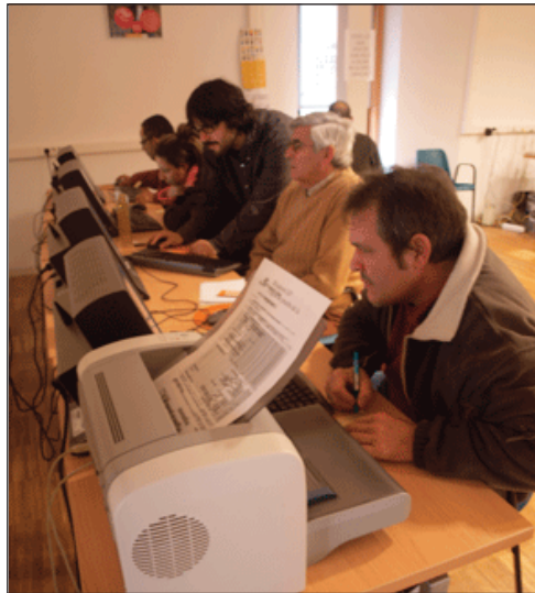
L'informàtic d'Alfara realitza un ensenyament personalitzat.

Són 10 els alumnes que assisteixen a les classes, dimarts i dijous de matins, per aprendre nocions bàsiques d'Internet. Varen començar el passat 19 de gener i es perllongarà fins l'11 de febrer, en una iniciativa del Consistori que ha tingut molt