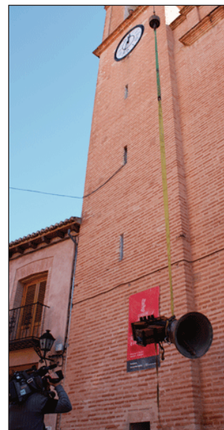
Instal·lació d'una campana restaurada.

Dels 11.000 euros que han costat estos treballs, que van culminar el passat 4 de març amb la instal·lació de les campanes a la torre de l'església, la Generalitat Valenciana ha subvencionat 6.000 euros. Els diners restants els està recopilant Don Álvaro amb la donació de diferents veïns i col·lectius del municipi.