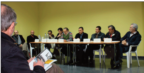
Un veí aten els participants en la xerrada sobre la Via Parc Nord.

Representants del col·lectiu Bòbila i d'Horta Viva també mostraren la seua oposició la Via Parc Nord, insistint en el fet que amb l'aparença de solucionar els problemes de mobilitat, amb la construcció de la carretera s'assentarien les bases d'una futura especulació del sol.