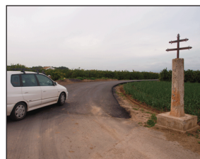
Inici del tram recentment asfaltat.

En la realització de les obres, pressupostades en