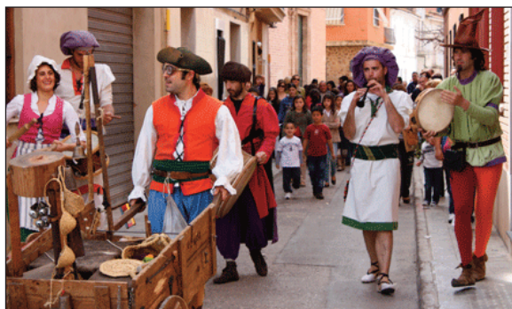
Teatre de carrer "El Ball de San Vito" amb la participació dels xiquets d'Alfara.

En primer lloc crec que el que caldria aconseguir es que els pocs comerços que encara queden no tancaren. Així si la gent vera que els comerços del poble funcionen, tal vegada intentaríem muntar-ne altres. Per aconseguir açò, hauríem de posar tots nosaltres de la nostra part i consumir als comerços