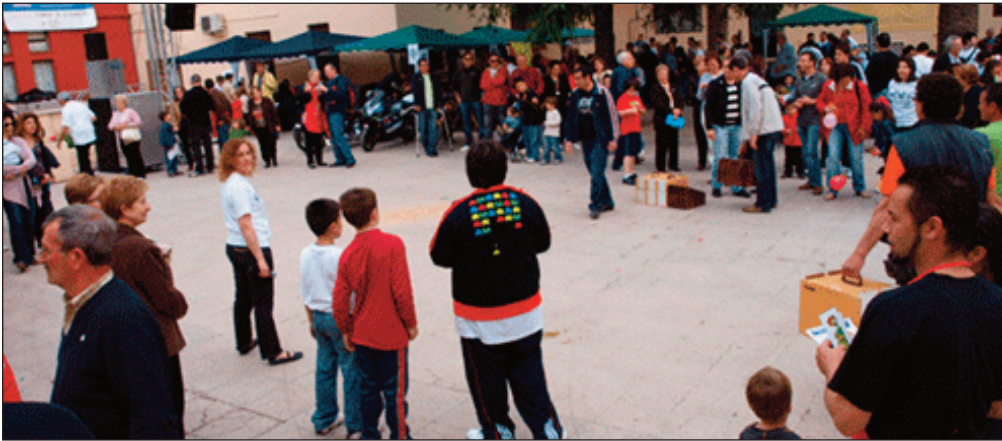
La Fira de les Associacions de l'any passat va comptar amb la participació de molta gent.