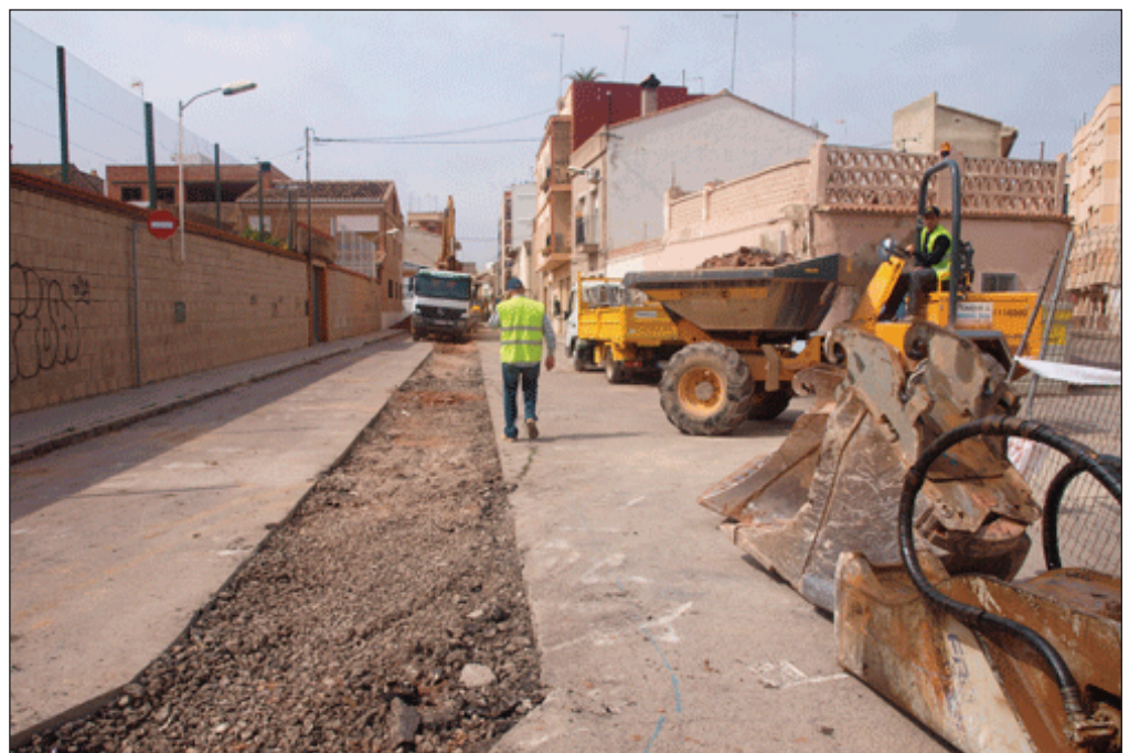
Els operaris treballen en el col·lector de pluvials.

El sector del Puntarró, la zona nova del Ceu, la carretera del Seminari, el camí de Rafelbunyol, la plaça 9 d'octubre i un tros del carrer Mestre Palau ja compten amb la xarxa separativa de sanejament. També està projectada a la zona que pròximament s'urbanitzarà a les antigues fàbriques de Monzó Cortell i de Contell.