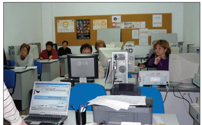
Primera edició del "Curs d'alfabetització informàtica per a dones".

El temari està dividit en dos parts: la primera d'elles