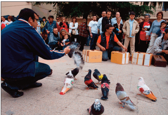
Activitat dels colomaires a la Fira d'Associacions de l'any passat.

Els veïns i veïnes d'Alfara tenim una cita el proper 24 d'abril als Jardins Municipals amb la celebració de la Fira d'Associacions. Una jornada totalment consolidada, que enguany arriba a la IX edició, en la que joves i majors gaudixen de les activitats preparades pels diferents col·lectius del municipi, com ara tallers de reciclatge, jocs tradicionals, un concurs de gossos o xerrades temàtiques, entre d'altres. Pàgina 3