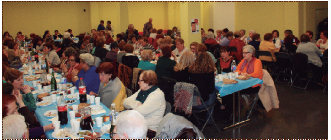
Cena para las socias de las Amas de Casa en conmemoración del Día de la Mujer.