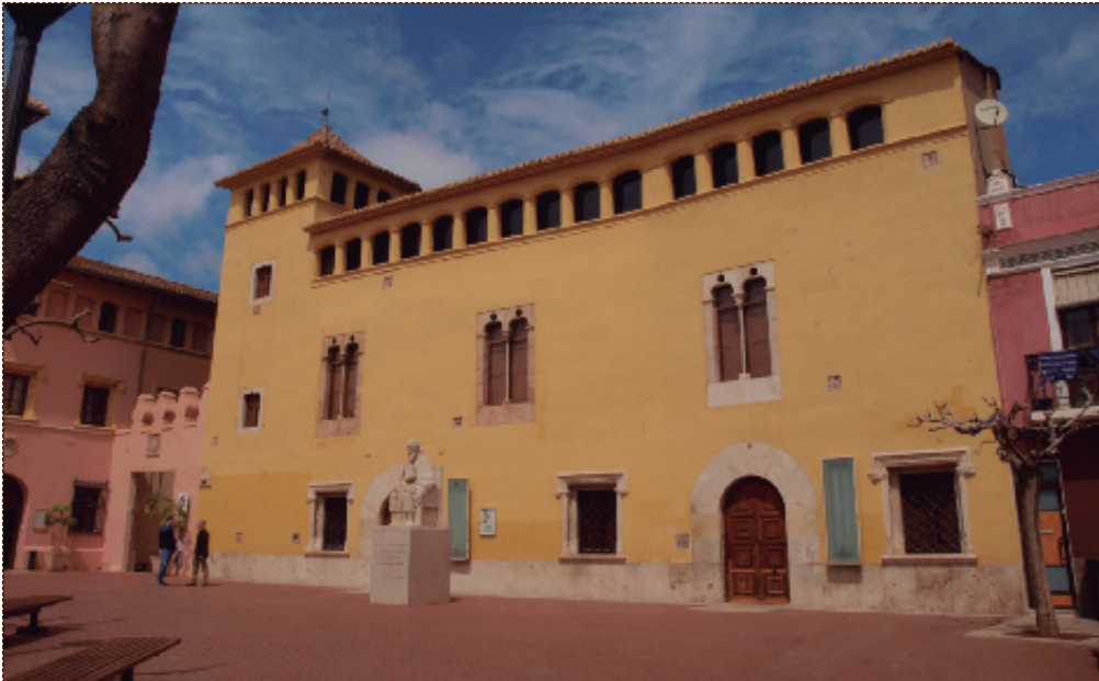
Palacio de la Señoría de Alfara del Patriarca, más conocido como el Castell.