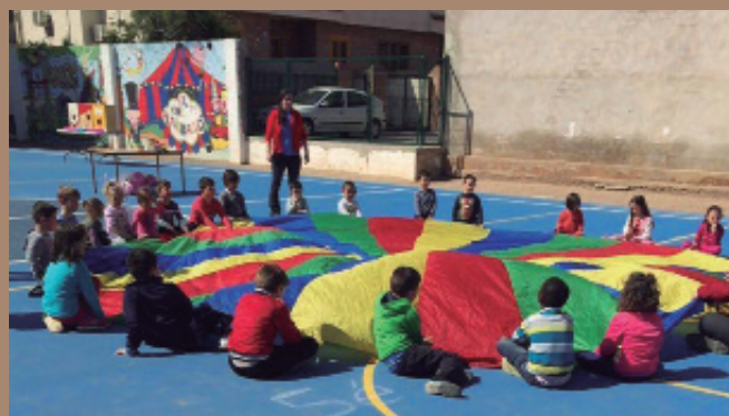
Los niños y niñas juegan con una tela gigante.