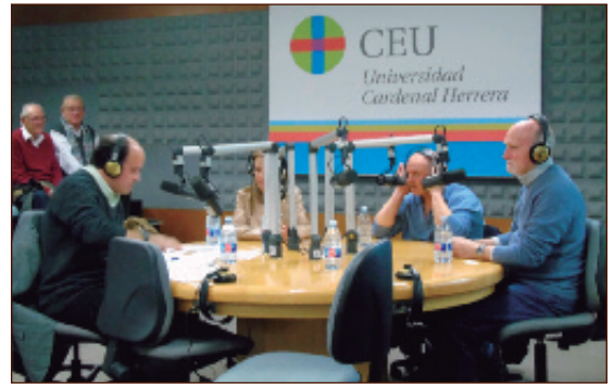
Programa de radio sobre el boxeador en los estudios del Ceu.