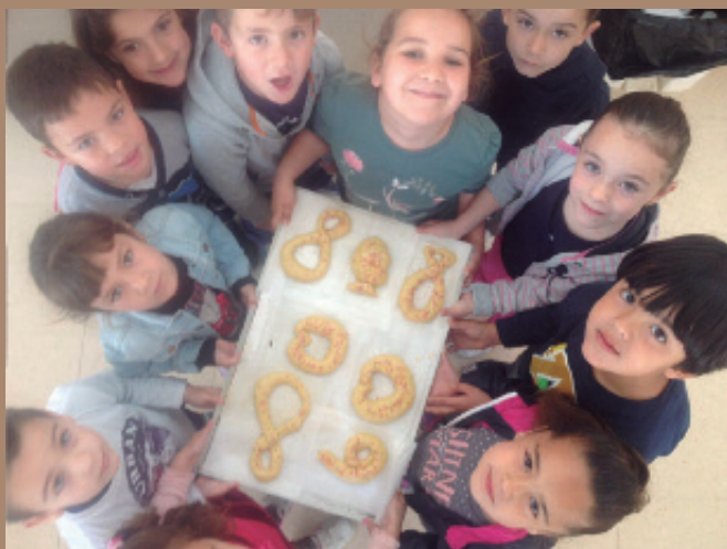
Taller de pastelería con la creación de monas de Pascua.

Entre el 29 de marzo y el 1 de abril cerca de 30 niños y niñas se apuntaron a los Talleres de Pascua organizados por el Ayuntamiento. Realizaron trabajos manuales, actividades deportivas y juegos tradicionales.