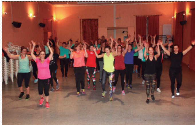
Clase abierta de gimnasia en el Teatret de Alfara.

nasia y la merienda que organizan las Amas de Casa.