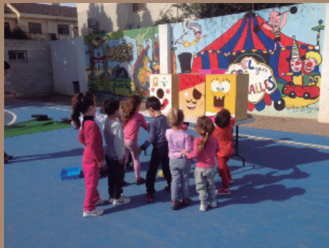
Juegos gigantes tradicionales, actividad desarrollada a través del SARC.