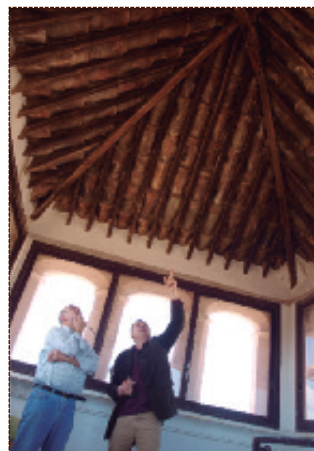
Sostre de la torre del Castell.

La actual restauración del Palacio de la Señoría comenzó en 2010 con tres subvenciones sucesivas del programa Ruralter. Inicialmente los trabajos se centraron en la aplicación de un