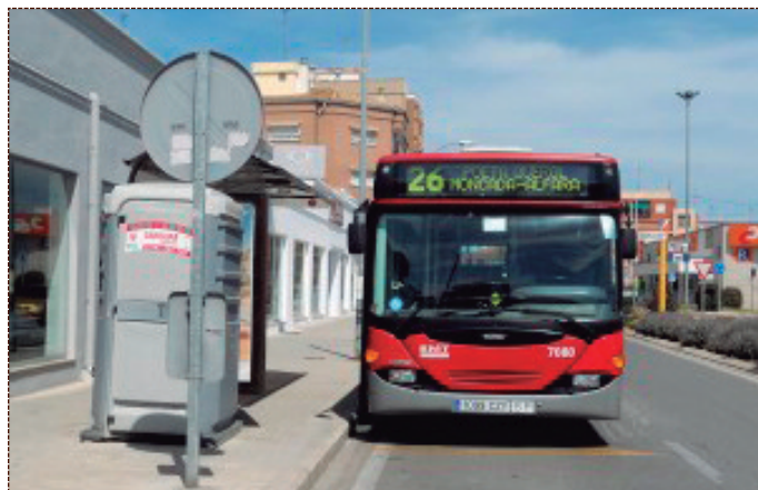
Línea 26 de l'autobús de l'EMT a la parada de Montcada-Alfara.

El Presidente de la Generalidad, Ximo Puig, junto con la consellera de Vivienda, Obras Públicas y Vertebración del Territorio, María José Salvador, mantuvo el pasado martes 12 de abril una reunión de trabajo en el Palau de la Generalitat con representantes de algunas de las poblaciones afectadas, con el objetivo de trasladarles la solución adoptada por las instituciones supra-municipales y poner fin a los problemas de movilidad planteados a los municipios en los que el anterior gobierno de la ciudad de Valen-