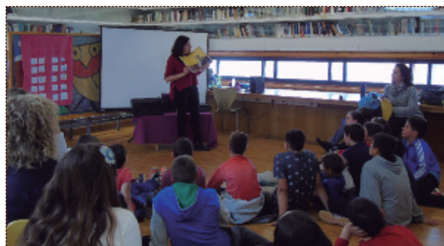
Visita de escolares a las instalaciones de la Biblioteca Municipal.