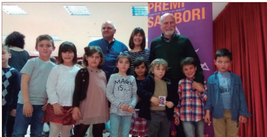
El alcalde, la profesora y el concejal de cultura con la clase de 5 años del colegio público, galardonada en el Sambori Comarcal.

El Ayuntamiento reconocerá la labor creativa de todos los alumnos participantes del pueblo el próximo 11 de mayo en el Teatret en la gala de premios del Sambori Local.