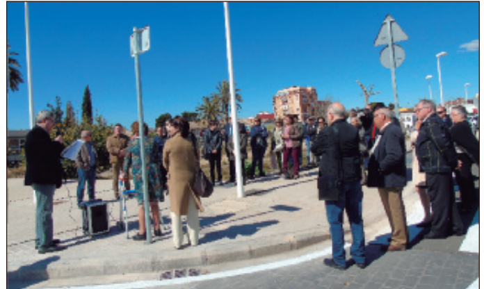
Inauguración de la calle que recuerda al campeón de boxeo entre 1934 y 1938.