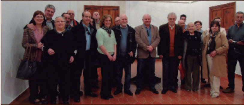
La comitiva en el Palacio de la Señoría de Alfara del Patriarca.