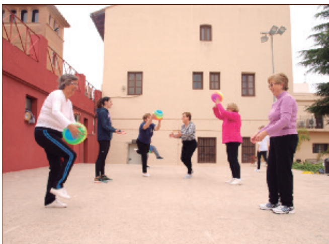
Gimnasia de mantenimiento en los Jardines Municipales para mujeres y mayores.

También se impartirán diferentes temas como la prevención de accidentes en el hogar, la resolución de conflictos o el uso de las nuevas tecnologías.